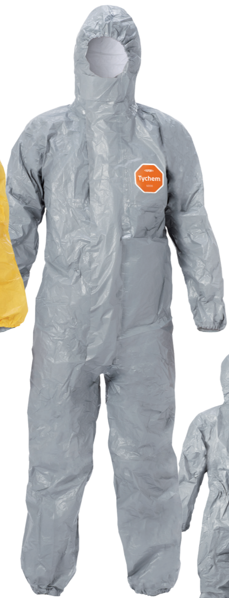
デュポン™ タイケム® 6000