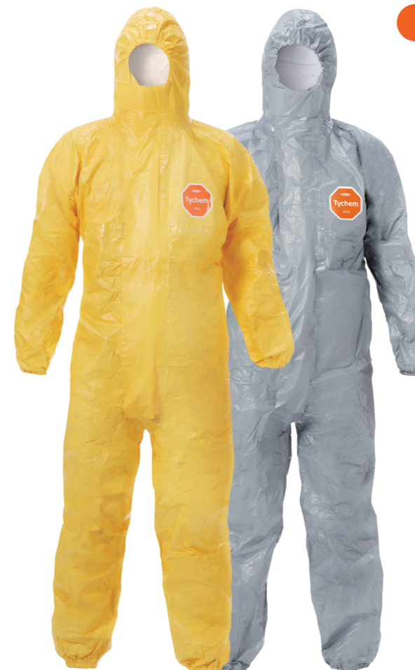
デュポン™ タイケム® 2000