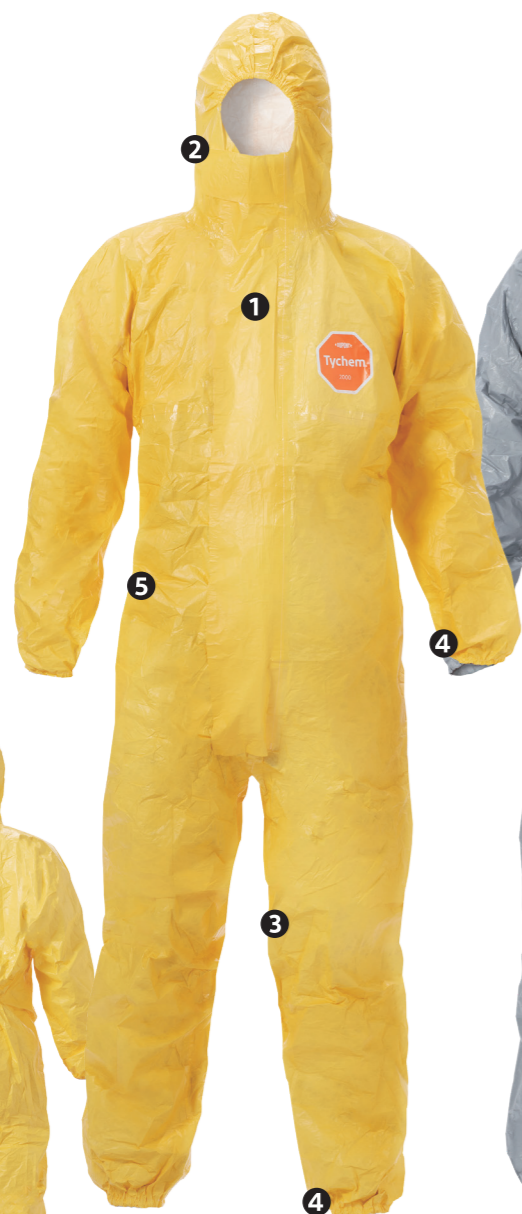
デュポン™ タイケム® 2000